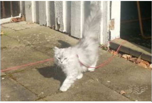
Capella växer upp.